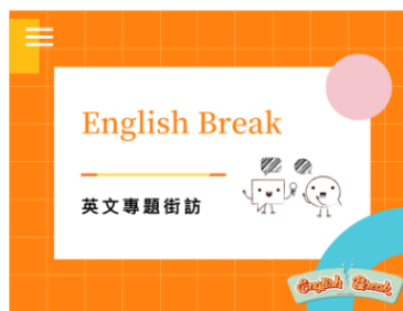
English Break 英文專題街訪