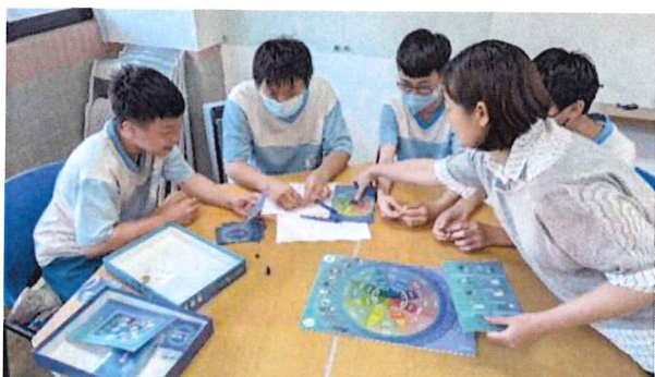
基隆信義國中成果記錄&教師訪談