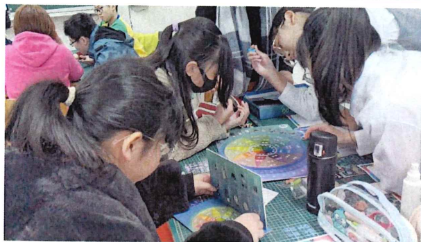
基隆信義國小成果記錄&輔導室老師、組長訪談