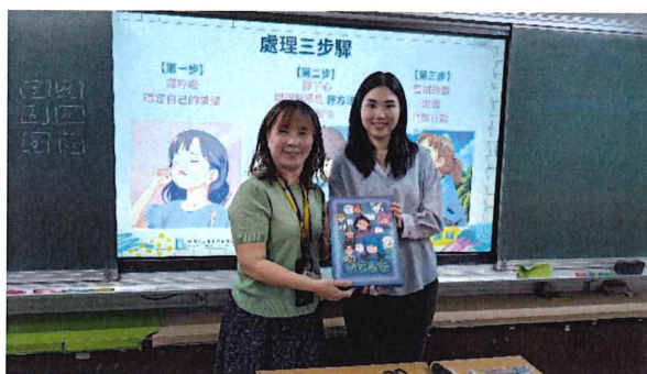
南投漳興國小成果記錄&輔導老師訪談