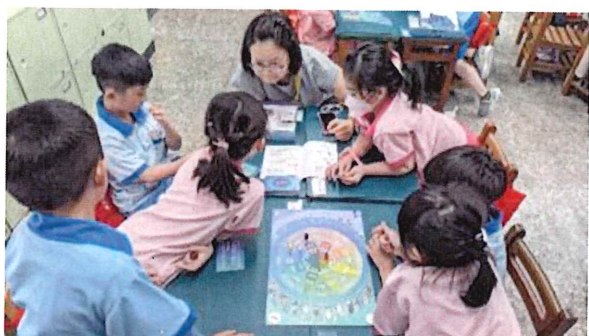
基隆仁愛國小成果記錄&輔導室老師訪談