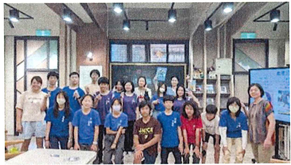
彰化縣民權華德福實驗國中小成果記錄&教師訪談