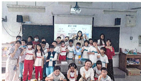
高雄樂群國小成果記錄&輔導老師訪談