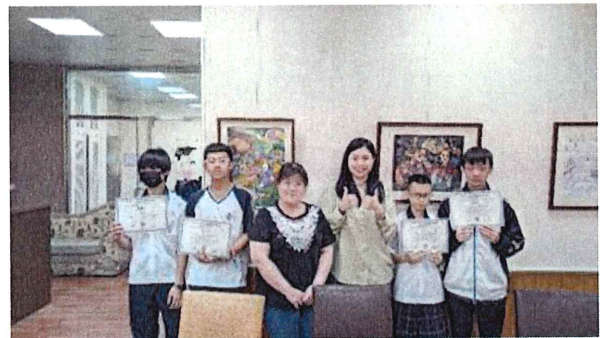
南投營北國中成果記錄&輔導室老師訪談