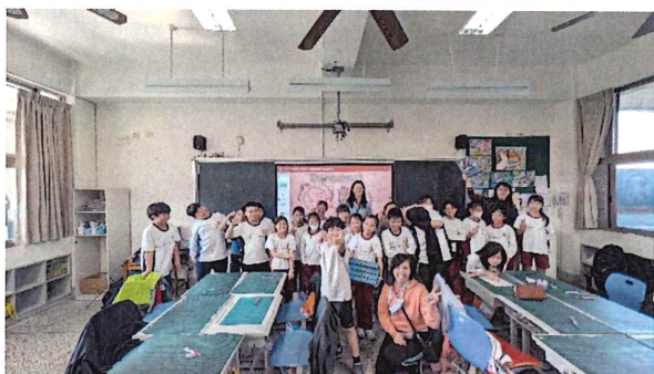
南投炎峰國小成果記錄&輔導老師訪談