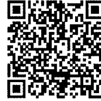
(夏日大作戰活動專屬頁面QRcode)